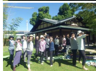
写真は今年のヨガ教室の様子