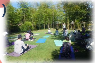
写真はヨガ教室の様子